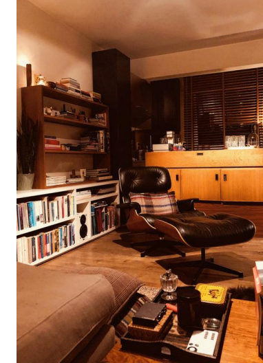
Aardetinten geven sfeer aan de ruimte.

TEKST: VEERLE BEIRNAERT