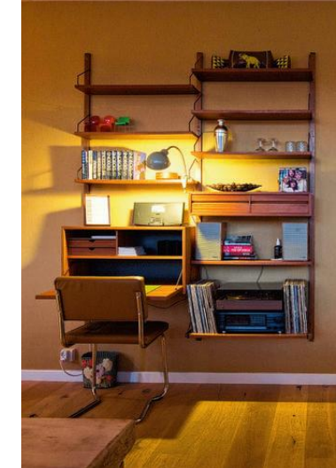
Met unieke voorwerpen wordt er iets bijzonders gecreëerd.