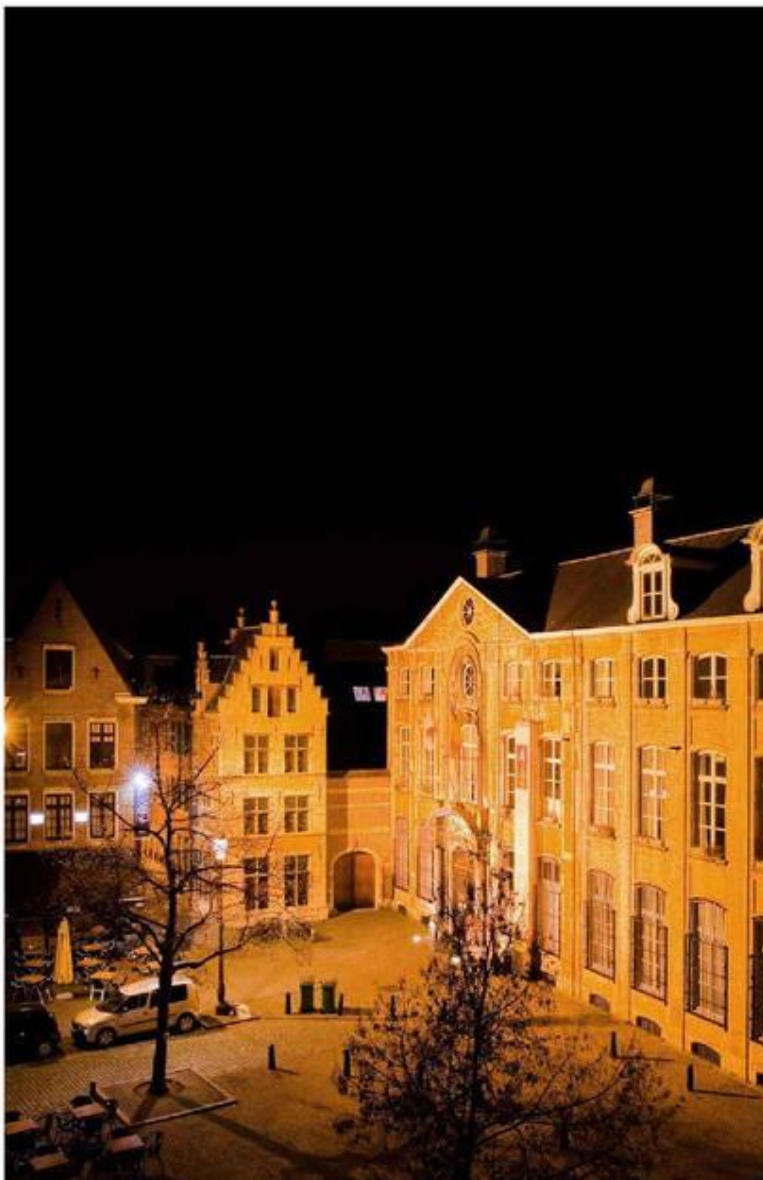
Aplace ligt aan de Vrijdagmarkt, vlak bij de shoppingstraten.

A place/Antwerp is de ideale locatie voor een weekendje onder meiden. 'Op de Vrijdagmarkt? Tussen die twee topstraten in: Lombardenvest en Steenhouwersvest? Dan kunnen we rustig shoppen en onze buit bij tussenpozen naar het appartement brengen. Dan hebben we de handen weer vrij om verder te shoppen. We moeten ook aan het praktische denken.' Mijn intuïtie zei dat het goed was. Alsof we terugkeren naar de prehistorie en samen gaan verzamelen, maar dan wel met onze actieradius in de duurdere straten. En hé, dat mag, want half januari draait de koopjesperiode op volle toeren. Dan zijn de fancy boetieks plots haalbaar en betaalbaar. Dachten we.