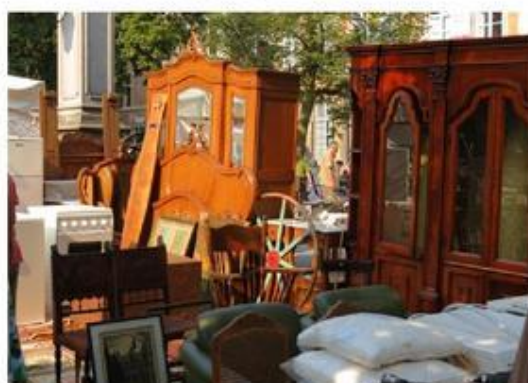
De inboedelverkoop op de Vrijdagmarkt.