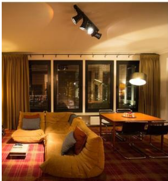
De gastvrouw verzamelde de designstukken in de loop der jaren.