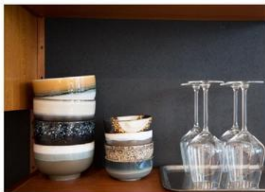
Zelfs het servies past in het plaatje.